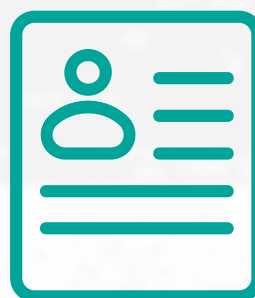
profil v k+portálu