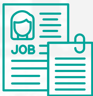
CV nebo motivační dopis